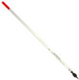
Drennan Crystal waggler

När det gäller val av flöte är det lätt, drennan crystal waggler eller drennan driftbeater flöte.